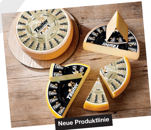
Plakatkampagne von der Kreativ-Agentur Ruf Lanz.